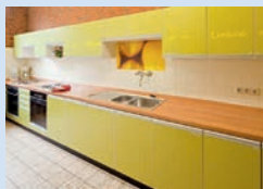
Alle Fotos auf dieser Seite © Katharina Jaeger

Das SommerHaus ist die ideale Unterkunft für Klassenfahrten, Gruppenreisen, Familientreffen, oder auch für Feiern! Zusammen mit den Ferienwohnungen im YachtHof haben wir Platz für über 100 Personen!